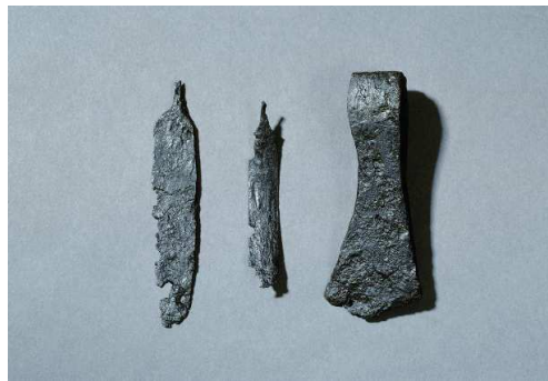
Abb. 1: Das Grab, bestehend aus Messer, Eimerhenkel und eiserner Streitaxt, wurde 1985 von zwei Schülern in Kamenz-Jesau entdeckt. Brandspuren an allen drei Objekten belegen, dass die Fundstücke als Grabbeigaben dem Leichenfeuer ausgesetzt waren.