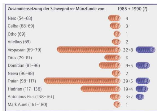
Abb. 3: Die 24 Silberdenare, die 1990 in Schwepnitz gefunden worden sein sollen, fügen sich in Zeitstellung, Typ und äußerer Beschaffenheit in den 1985 gefundenen Schwepnitzer Münzhort ein. Dies ist ein Indiz dafür, dass es sich hierbei ursprünglich um einen großen Hortfund gehandelt hat (HEINRICHS 2004).