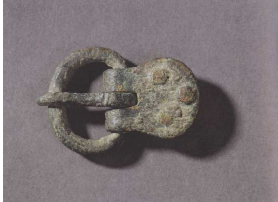
Abb. 5: Die völkerwanderungszeitliche Schnalle aus Kopschin kann aufgrund des Vergleichsmaterials in die erste Hälfte des 5. Jh. n. Chr. datiert werden. Schnallen diesen Typs kennen wir ansonsten aus dem nördlichen Elbbereich, aus Mähren und dem Westbalkan (MADYDA-LEGUTKO 1986, S. 73 ff.).

die Herkunft der Zeißholzer Kanne nicht so scharf eingegrenzt werden wie diejenige des Jesauer Hortes; trotzdem machen beide Funde deutlich, wie unmittelbar die Westlausitz von den Auswirkungen der Völkerwanderungszeit betroffen scheint. In die erste Hälfte des 5. Jh. werden die Niemberger Fibel, Variante C aus Uhyst an der Spree (BEMMANN 2001, SCHULTE 1997) und die Kopschiner Gürtelschnalle, s. Abb. 5, (KOCH 2004) datiert, die gleichzeitig den Abschluss der odergermanischen Besiedlung in der westlichen Oberlausitz markieren. Für das Gebiet um Bautzen lassen sich für die Völkerwanderungszeit keine Funde mehr nachweisen. In der südlichen Niederlausitz weist die Niemberger Fibel, Variante C aus Leuthen (BEMMANN 2001) daraufhin, dass auch hier in der ersten Hälfte des 5. Jh. noch mit Bevölkerungsresten zu rechnen ist.