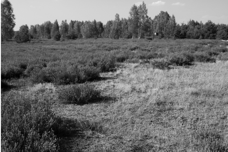
Abb. 5 Vorkommensgebiet von Cicindela sylvatica in der Muskauer Heide

Cicindela sylvatica (Abb. 4) hat in der Muskauer Heide nach aktueller Datenlage einige der bedeutendsten zusammenhängenden Teilpopulationen der Art innerhalb des Verbreitungsgebietes in Deutschland. Überwiegend sind diese in weiträumigen Zwergstrauchheiden auf genutzten oder ehemaligen Truppenübungsplätzen wie dem „TÜP Oberlausitz“ angesiedelt. Das aktuelle Verbreitungsbild in Deutschland (Karte 2) ist annähernd vollständig und veranschaulicht durch die differenzierte Darstellung der Fundpunkte in verschiedenen Zeithorizonten die aktuelle Situation.