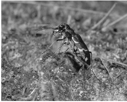
Abb. 4 Cicindela sylvatica in ihrem natürlichen Habitat