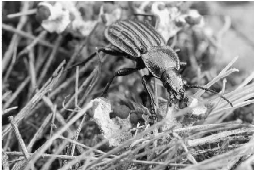
Abb. 6 Carabus nitens

Ein weiterer stenotoper Heidebewohner ist der in Sachsen als ausgestorben bzw. verschollen geltende Callisthenes reticulatus . (Abb. 7) Der Puppenräuber mit eurosibirischer Verbreitung scheint teilweise ähnliche Habitatansprüche wie Carabus nitens zu besitzen. Aus den vorhandenen aktuellen Daten und den Beschreibungen der Fundumstände (HORION 1941, PÜTZ 1995) lässt sich ableiten, dass die Art tatsächlich nahezu ausschließlich in steppenähnlichen Biotopen lebt, zu denen früher auch Äcker und Ackerbrachen gehören konnten. Bei der intensiveren Recherche der in der Literatur erwähnten Fundorte ist feststellbar, dass es sich sowohl bei historischen als auch bei den aktuellen Fundplätzen in vielen Fällen um militärisch genutzte Übungsgebiete handelt. Die von NÜSSLER & GRÄMER (1996) angeführten Vorkommen auf Rübenschlägen sind offenbar die Ausnahme.