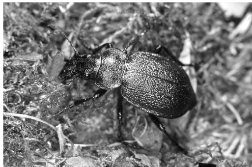
Abb. 7 Callisthenes reticulatus

Auf dem TÜP Oberlausitz finden sich seit über 60 Jahren weiträumig ähnliche Bedingungen wie auf den brandenburgischen Truppenübungsplätzen. Das lässt die Wahrscheinlichkeit, Callisthenes reticulatus hier ebenfalls nachzuweisen, recht hoch erscheinen, zumal alte Belege aus der Dahlen-Dübener- und der Königsbrücker Heide sowie aus der Umgebung von Forst in der