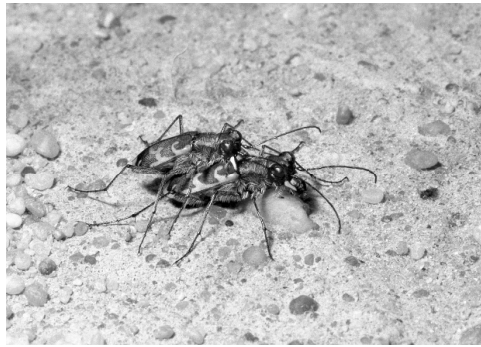
Abb. 3 Cylindera arenaria viennensis (in Kopula)

Aus Karte 1 ist deutlich erkennbar, dass der Schwerpunkt der aktuellen Vorkommen der Art in Deutschland hier in der Oberlausitz angesiedelt ist. Angesichts der zusehends fortschreitenden Sukzession ist aber auch hier – wie oben genannt – nur temporär ein neuer Lebensraum durch Nutzung (Übungsbetrieb) entstanden. Bei Ausbleiben oder deutlichem Rückgang der Nutzung besonders auf diesen Flächen wird die Art sich nicht dauerhaft halten können.