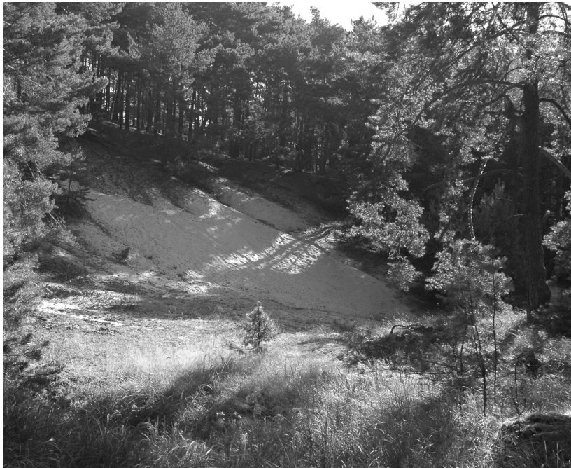
Abb. 1 Offene Binnendünen bei Daubitz, Lebensräume psammophiler Arten wie Cicindela hybrida , Harpalus neglectus , Harpalus flavescens , Harpalus hirtipes , Amara quenseli u.v.a.m.

Neben den seit langem bekannten Sekundärlebensräumen (Tagebaue, Kiesgruben) wurde Cylindera arenaria viennensis (Abb. 3) mittlerweile auch weitab von Fließgewässern (Primärhabitat) auf dem TÜP Oberlausitz gefunden. Hier siedelt sie regelmäßig auf schwach mergelhaltigen Böden in Fahrspurbereichen zwischen Silbergrasfluren (BÖHNERT et al. 1995, WANNER et al. 2001, 2002, 2003).