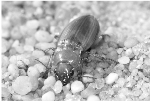
Abb. 2 Harpalus flavescens