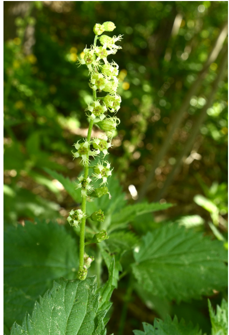
Abb. 3a+b: Großblütige Tellima ( Tellima grandiflora ), auch falsche Alraunenwurzel genannt.