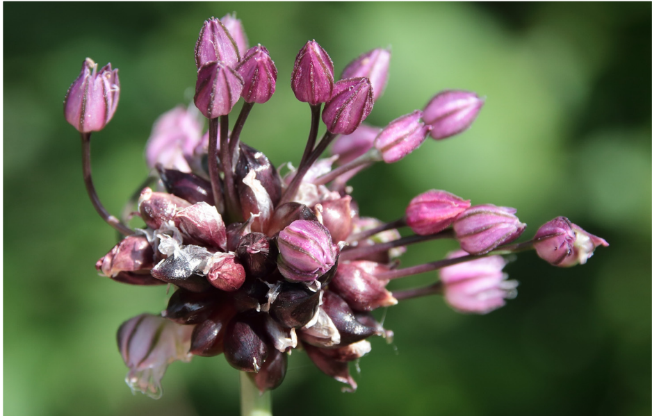
Abb. 1: Schlangen-Lauch ( Allium scorodoprasum ).