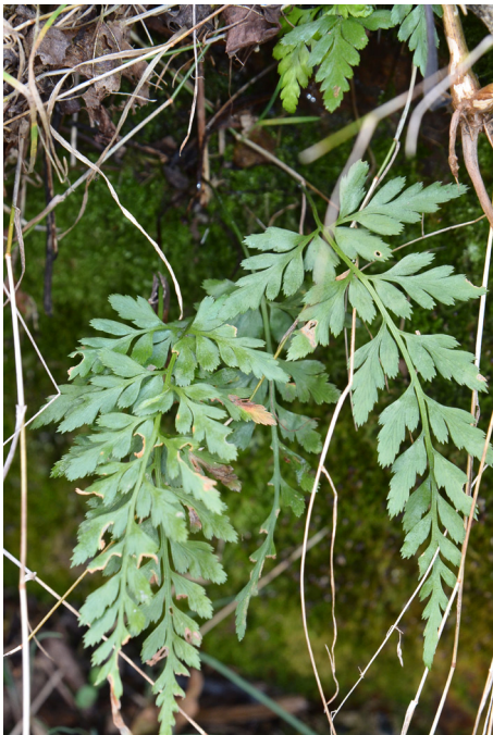
Abb. 2: Schwarzstieliger Streifenfarn ( Asplenium adiantum-nigrum ).

OLH 4955/41 Zittau NO: Ostritz, Ackerland an der B 99 bei Feldleuba, ca. 25 Expl. (Wünsche).